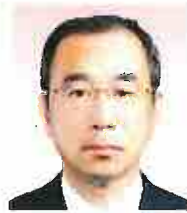
委員 そのやま しげる 園山 繁 出雲 自民党議員連盟