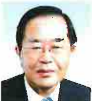
委員 いとはら とくやす 絲原 徳康 仁多 自民党議員連盟